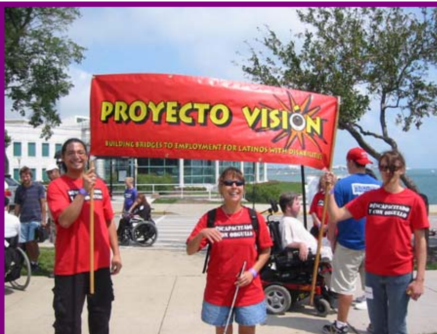
El personal de Proyecto Visión hace capacitaciones en una actividad de orgullo de la discapacidad en staff Chicago, Illinois.